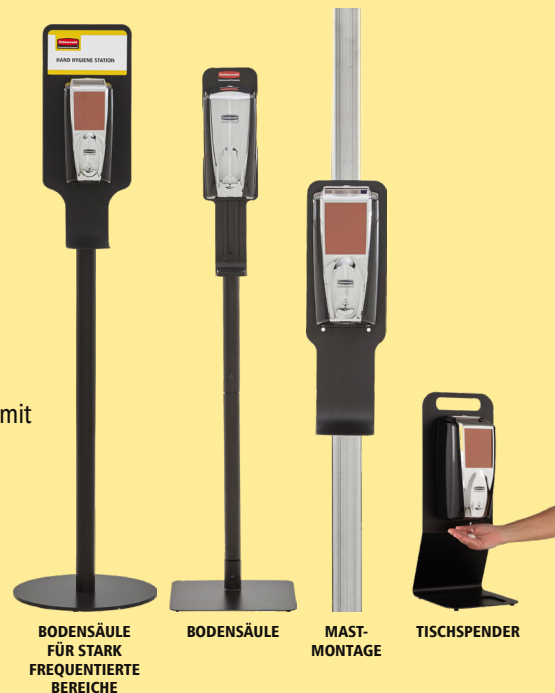
BODENSÄULE FÜR STARK FREQUENTIERTE BEREICHE

Bei einer Dosisgröße von 0,4 ml erhalten Sie bis zu 2.750 Dosen pro 1.100-ml-Nachfüllpackung